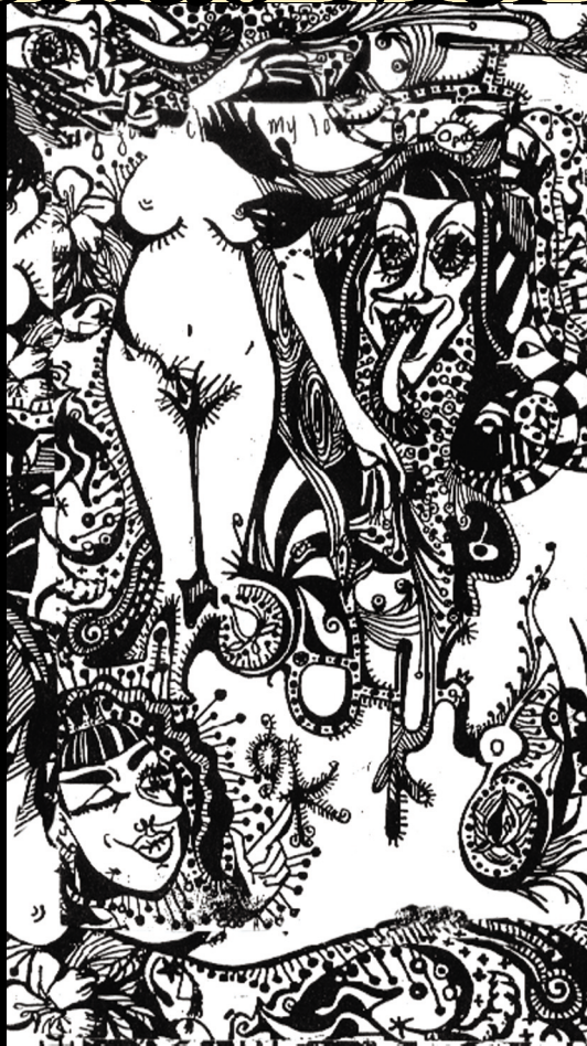
圖3 駱巧梅 隨手塗鴉 2003 簽字筆 15×9CM