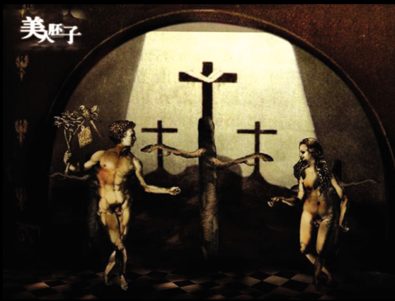
圖2 駱巧梅 偶動畫海報 2004 電腦繪圖 全開