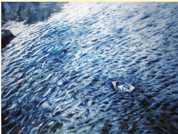
圖5 蔡奕勳 不去亦不來 2003 水彩 全開