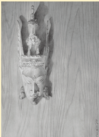
圖6 蔡奕勳 容顏 2003 素描 對開

個案A：爸爸辛苦賺錢，讓我努力不懈與藝術學習挑戰；媽媽將佛法融於我們的生活中，學習到的是更深更圓融的藝術；總歸一句「爸媽就是藝術」，藝術從情感所生。