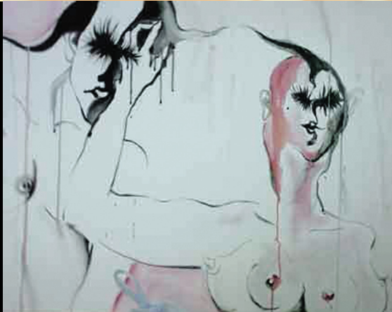
圖1 駱巧梅 無題 2003 水墨 80×65CM